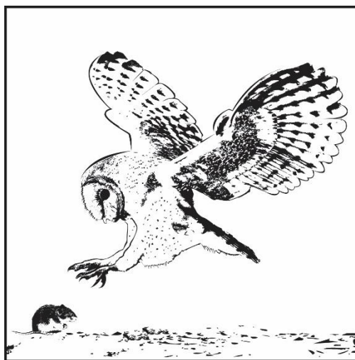
Płomykówka polująca na normika