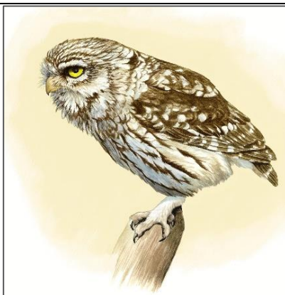
Pójdźka na czatowni – rys. Marek Kołodziejczyk